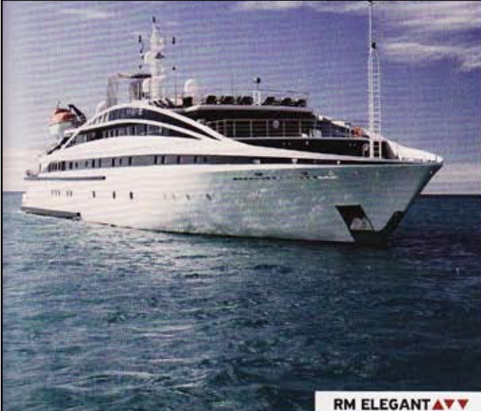
RM ELEGANT ▲▼▼