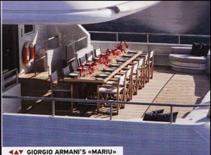
◀▶ GIORGIO ARMANI'S «MARIU»